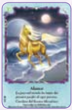
Alamar ○01/55 ◆S1/55

Scopri i cavalli fatati! Ogni codice segreto attiva nuove avventure magiche su BellaSara.com ! Quali avventure scoprirai coi tuoi codici segreti?