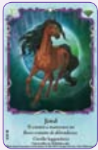
Jewel ○12/55 ◆S12/55