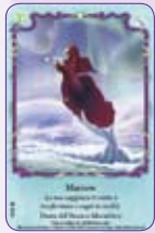
Merrow ○15/55 ◆S15/55