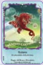
Ticklebit ○34/55 ◆S34/55