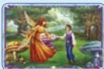
Pietra Lunare ○51/55 ◆S51/55