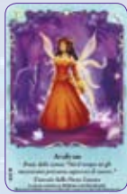
Avalynn ○44/55 ◆S44/55