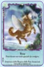
Twee ○37/55 ◆S37/55