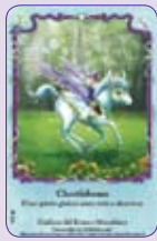
Chortlebones ○07/55 ◆S7/55