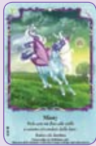
Minty ○16/55 ◆S16/55