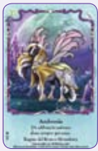
Ambrosia ○03/55 ◆S3/55