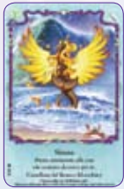
Sirena ○30/55 ◆S30/55