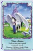
Wings & Emma ○43/55 ◆S43/55