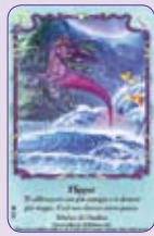
Flipper ○09/55 ◆S9/55