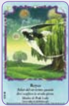
Royce ○29/55 ◆S29/55