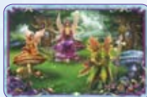
Corte Fatata ○48/55 ◆S48/55