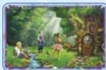
Porta Fatata ○47/55 ◆S47/55