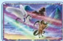
Cavalcare sui Raggi di Luna ○52/55 ◆S52/55