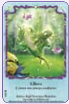
Lillova ○13/55 ◆S13/55