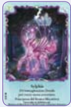
Sylphie ○31/55 ◆S31/55