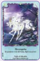
Moonsprite ○20/55 ◆S20/55