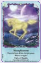
Moonphantom ○19/55 ◆S19/55