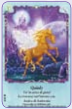
Quinly ○28/55 ◆S28/55