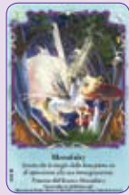
Moonfairy ○18/55 ◆S18/55