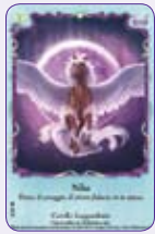
Nike ○23/55 ◆S23/55