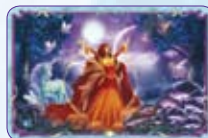
Risveglio ○49/55 ◆S49/55