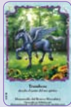
Trumbeau ○36/55 ◆S36/55