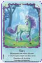
Tiara ○33/55 ◆S33/55