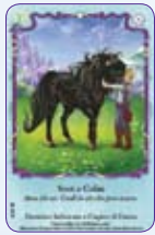
Soot & Colm ○41/55 ◆S41/55