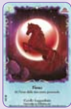
Fiona ○08/55 ◆S8/55