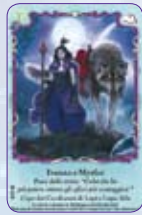
Ivenna & Myrfor ○45/55 ◆S45/55