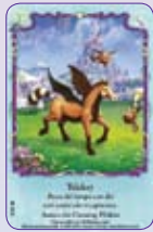
Tricksy ○35/55 ◆S35/55