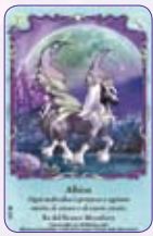
Albion ○02/55 ◆S2/55