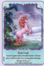
Pink Lady ○27/55 ◆S27/55