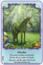
Gherkin ○10/55 ◆S10/55