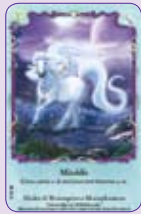
Mireldis ○17/55 ◆S17/55