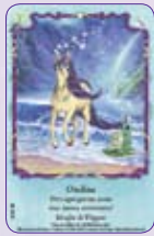
Ondine ○25/55 ◆S25/55