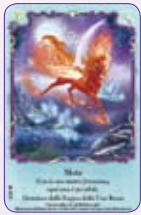
Mote ○21/55 ◆S21/55