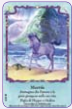
Murttie ○22/55 ◆S22/55