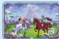
Matrimonio da Favola ○55/55 ◆S55/55

©2010 Hidden City Games, Inc. Tutti i diritti riservati. BELLA SARA è un marchio registrato di Concept Card ApS, utilizzato da Hidden City Games su licenza. HIDDEN CITY GAMES e HIDDEN CITY ENTERTAINMENT sono marchi registrati di Hidden City Games, Inc., negli U.S.A. e altrove. www.bellasara.com