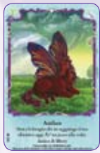
Anthea ○05/55 ◆S5/55