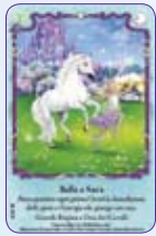
Bella & Sara ○40/55 ◆S40/55