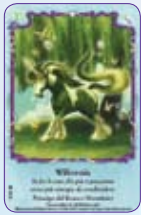
Willownix ○39/55 ◆S39/55