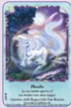
Phoebe ○26/55 ◆S26/55