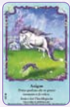
Anigan ○04/55 ◆S4/55