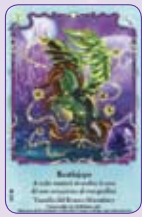
Beetlejape ○06/55 ◆S6/55