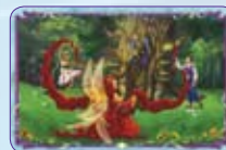
Amanti Riuniti ○50/55 ◆S50/55