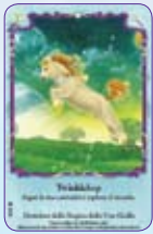
Twinklehop ○38/55 ◆S38/55