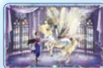
Moonfairy Ritrovato ○54/55 ◆S54/55