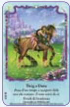
Twig & Deru ○42/55 ◆S42/55