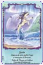
Janie ○11/55 ◆S11/55