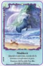
Nimblewit ○24/55 ◆S24/55