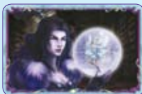
Globo Fatato ○46/55 ◆S46/55