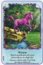
Maypop ○14/55 ◆S14/55